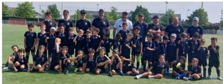
Les joueurs du club d'Ain sud foot médaillés.

Le jour de la fête du Travail, les bénévoles du club étaient présents au stade du forum des sports pour gérer l'organisation du tournoi U7 qui regroupaient 24 équipes soit 170 joueurs âgés de 7 ans. Sous le soleil, plus de 85 matchs ont été joués et une nuée de buts marqués. Chacun est reparti avec une médaille. À noter que lors du week-end des 16 et 17 mai, le club d'Ain Sud, en collaboration avec Foot Events, organise un tournoi regroupant 48 équipes U7 avec la présence de quelques clubs professionnels comme l'Olympique de Marseille, Nice, Le Havre ainsi que des clubs régionaux et départementaux.