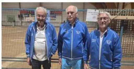
Les qualifiés mauriciens.

33 doubles du secteur de la Côtère s'étaient donné rendez-vous à Saint-Maurice-de-Beynost pour le qualificatif M4. Au terme des six parties, 14 clubs seront représentés au championnat de l'Ain. Les deux équipes de l'Olympique Boules se sont arrêtées en 8 e . En M3 à Montluel, l'équipe de Michael Brezard et celle de Valentin Ferlat ont obtenu leur ticket pour le championnat de l'Ain à La Boisse les 16 et 17 mai.